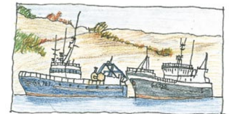
FISKEBÅTAR I SYDHAMNEN