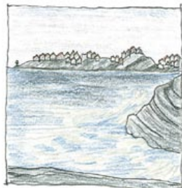
UTSIKT MOT ÅSTOL FRÅN RÄVLE UDD