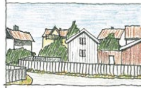
"HANS' KRISTNAS HUS"