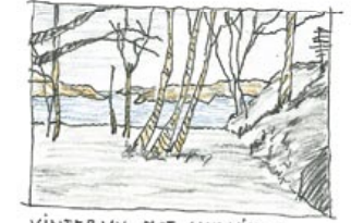
VINTERVY MOT SANDVIKEN